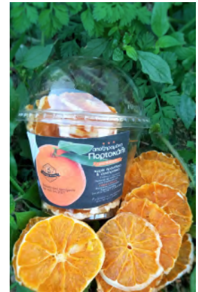
Αποξηραμένο πορτοκάλι σε φέτες - 35γ

Είναι ευρέως γνωστό ότι το πορτοκάλι είναι εξαιρετική πηγή βιταμίνης C. Αυτό που ενδεχομένως δεν είναι τόσο γνωστό είναι πως το πορτοκάλι έχει υψηλή περιεκτικότητα πηκτίνης που συμβάλλει στην μείωση της κακής χοληστερίνης (LDL). Επιπλέον παρέχει με λίγες θερμίδες σημαντικές ποσότητες σε φολικό οξύ, κάλιο, ασβέστιο και αντιοξειδωτικά.