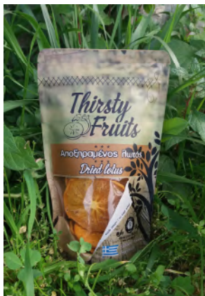
Αποξηραμένος λωτός σε φέτες 100γ