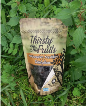
Αποξηραμένο δαμάσκηνο χωρίς κουκούτσι - 200γ