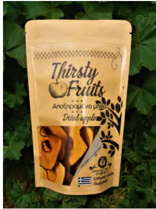
Αποξηραμένο μήλο σε φέτες - 25γ