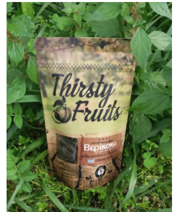
Αποξηραμένο βερίκοκο χωρίς κουκούτσι - 200γ

Ξεχωρίστε τα απαλλαγμένα από θείο, ζάχαρη και συντηρητικά βερίκοκα της Thirsty Fruits από το σκούρο καφέ τους χρώμα και πειστείτε για την ανώτερη γεύση τους δοκιμάζοντάς τα!