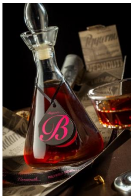
ΦΙΑΛΗ: 500ML Η ΦΙΑΛΗ ΔΕΝ ΕΙΝΑΙ ΔΙΑΘΕΣΙΜΗ