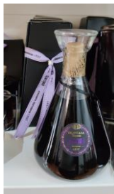
ΒOTTLE: 500ML Η ΦΙΑΛΗ ΔΕΝ ΕΙΝΑΙ ΔΙΑΘΕΣΙΜΗ