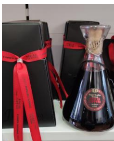
ΒOTTLE: 500ML Η ΦΙΑΛΗ ΔΕΝ ΕΙΝΑΙ ΔΙΑΘΕΣΙΜΗ