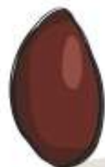
SUPER - COLOSSAL 111/120

Η ελιά Καλαμών είναι μία από τις καλύτερες και παγκοσμίως γνωστές επιτραπέζιες ποικιλίες ελιάς, με χαρακτηριστικό το βαθύ σκούρο της χρώμα και την σπάνια έντονη γεύση της.