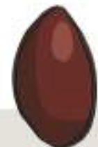
EXTRA JUMBO 161/180