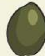
EXTRA LARGE 201/230