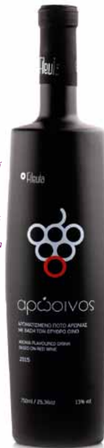
Φιάλη 750ml. Vol. 13%

Ο ερυθρός Αρώινος μπορεί να συνοδέψει ένα τραπέζι γεμάτο εκπλήξεις. Κυνήγι και κρέατα με πλούσιες σάλτσες. Ταιριάζει εξαιρετικά στο τέλος του γεύματος με ένα πιάτο τυριών κατά προτίμηση ώριμα και πικάντικα. Απολαμβάνεται και μόνο του με ξηρούς καρπούς και σοκολάτα.