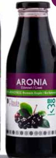
Φιάλη 500 ml.