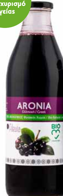
Γυάλινη Φιάλη 1lit.