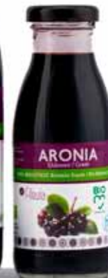
Φιάλη 250 ml.