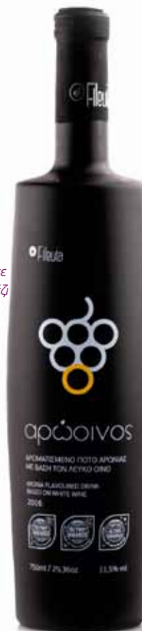
Φιάλη 750ml., Vol. 11,5%

Ο λευκός Αρώινος μπορεί να συνοδέψει ένα τραπέζι γεμάτο εκπλήξεις. Ιδανικό για να ανοίξετε το γεύμα ως aperitif. Στο τραπέζι θα φέρει την εκλεπτυσμένη σε πιάτα με ψάρι, με λευκά κρέατα και πουλερικά. Γλυκιά και ξινή αρμονία, όπως σάλτσες με μέλι ή ξύσμα εσπεριδοειδών. Ιδανικό με εξωτικά πιάτα, πικάντικες ασιατικές συνταγές ή taginers της Β. Αφρικής. Απολαμβάνεται και μόνο του με τα φρούτα της εποχής.